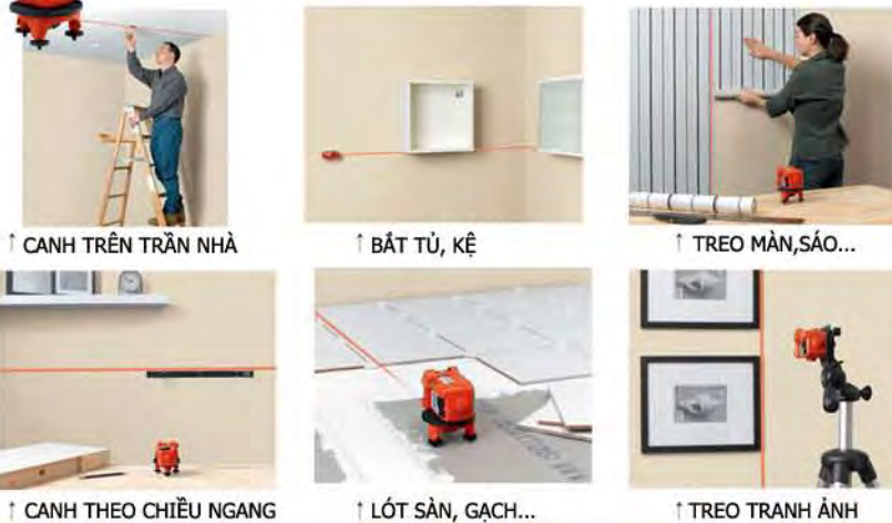
↑ CANH TRÊN TRẦN NHÀ