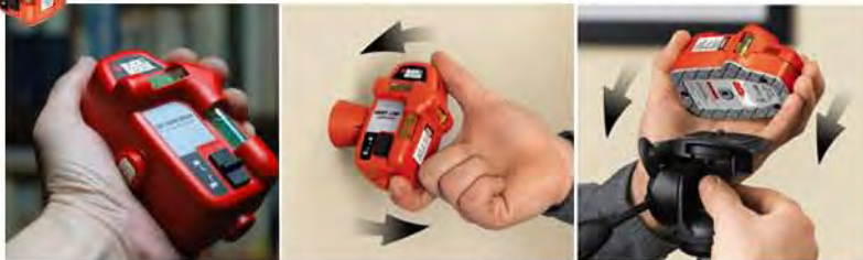
KÍCH THƯỚC NHỎ